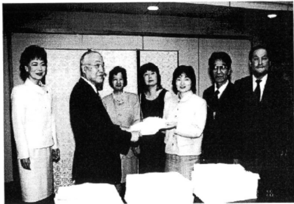
高秀市長に陳情書と署名簿を渡す地域住民の代表ら。 松参議院議員（左）と源波市会議員（右）が立ち会いました。

「白百合・領家・中田東地区から地下鉄踊場駅へのアクセス道路として多くの人が利用、さらに通学路になっているにもかかわらず極めて幅員が狭く危険な状態」との声が地域住民からあがっていました。